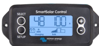
Pantalla enchufable SmartSolar