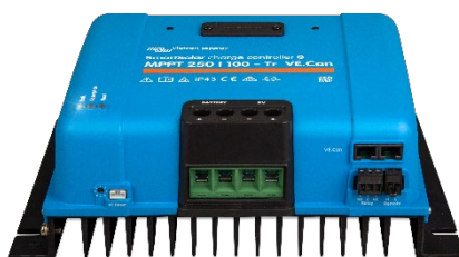
Controlador de carga SmartSolar MPPT 250/100-Tr-VE.Can sin pantalla