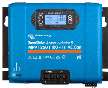
Controlador de carga SmartSolar MPPT 250/100-Tr-VE.Can con pantalla conectable opcional