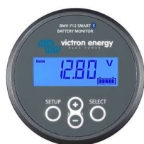
Sensor Bluetooth: Monitor de baterías BMV-712 Smart