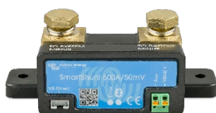
Sensor Bluetooth: SmartShunt