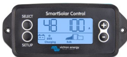
Pantalla enchufable SmartSolar