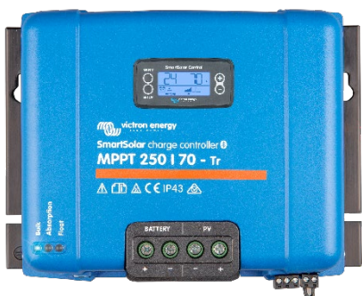
Controlador de carga SmartSolar MPPT 250/70-Tr Con pantalla conectable opcional.