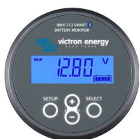
Detección de Bluetooth: BMV-712 Smart Battery Monitor