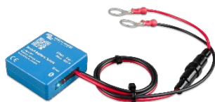
Detección de Bluetooth: Smart Battery Sense