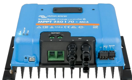
Controlador de carga SmartSolar MPPT 250/70-MC4 sin pantalla