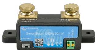
Detección Bluetooth: SmartShunt